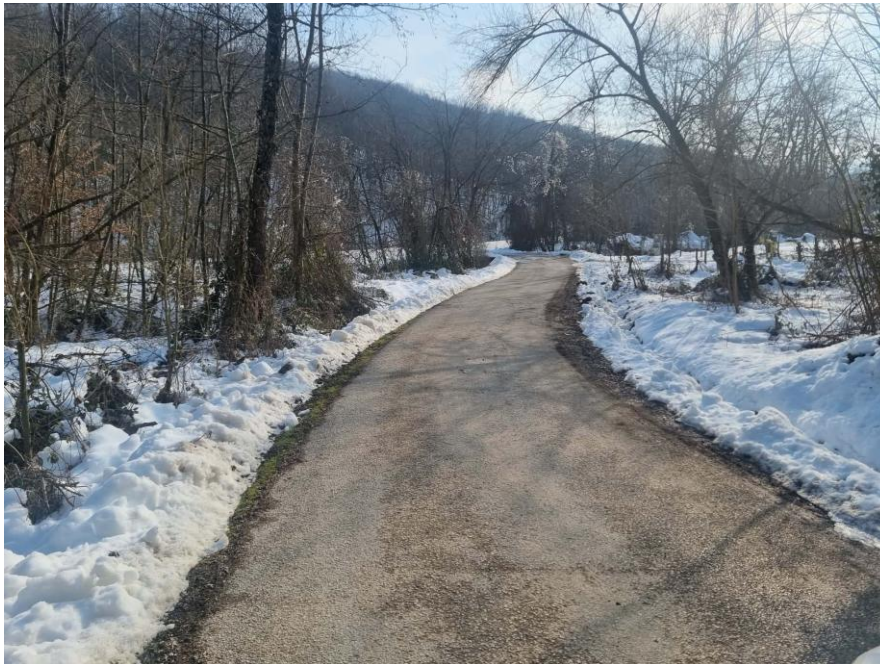
Fotografije dijela pristupnog puta