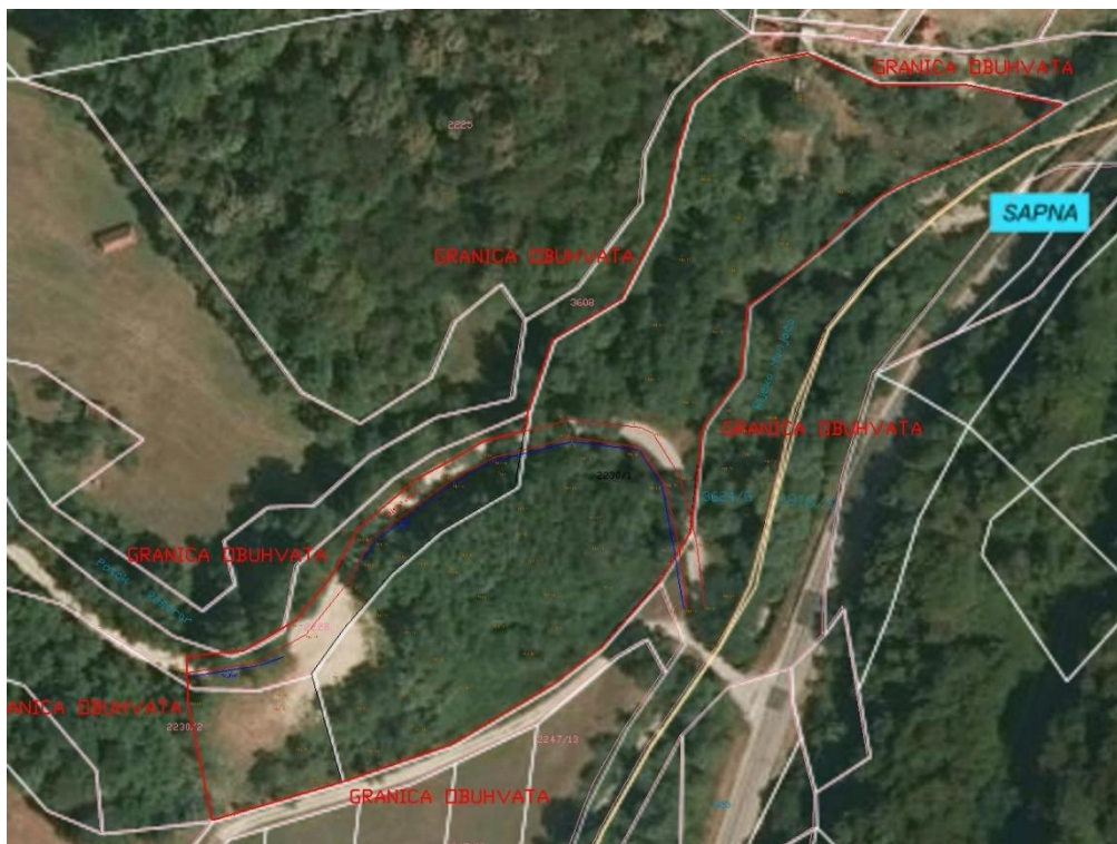
Prikaz predmetnog obuhvata na ortofoto podlozi

Površina obuhvata iznosi 10.746,85 m 2 . U površinu obuhvata nije ušla površina pristupnih puteva prema planiranom Etnu selu, ali jeste put prema MZ Šarci.