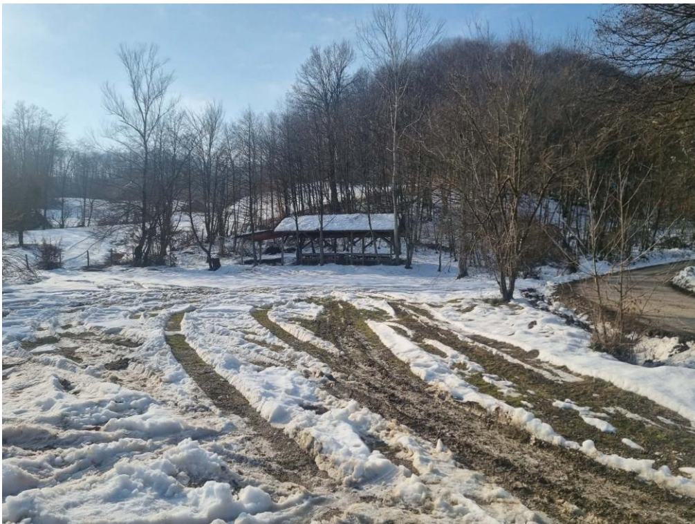
Fotografije dijela predmetne lokacije /zaravnjeni plato/