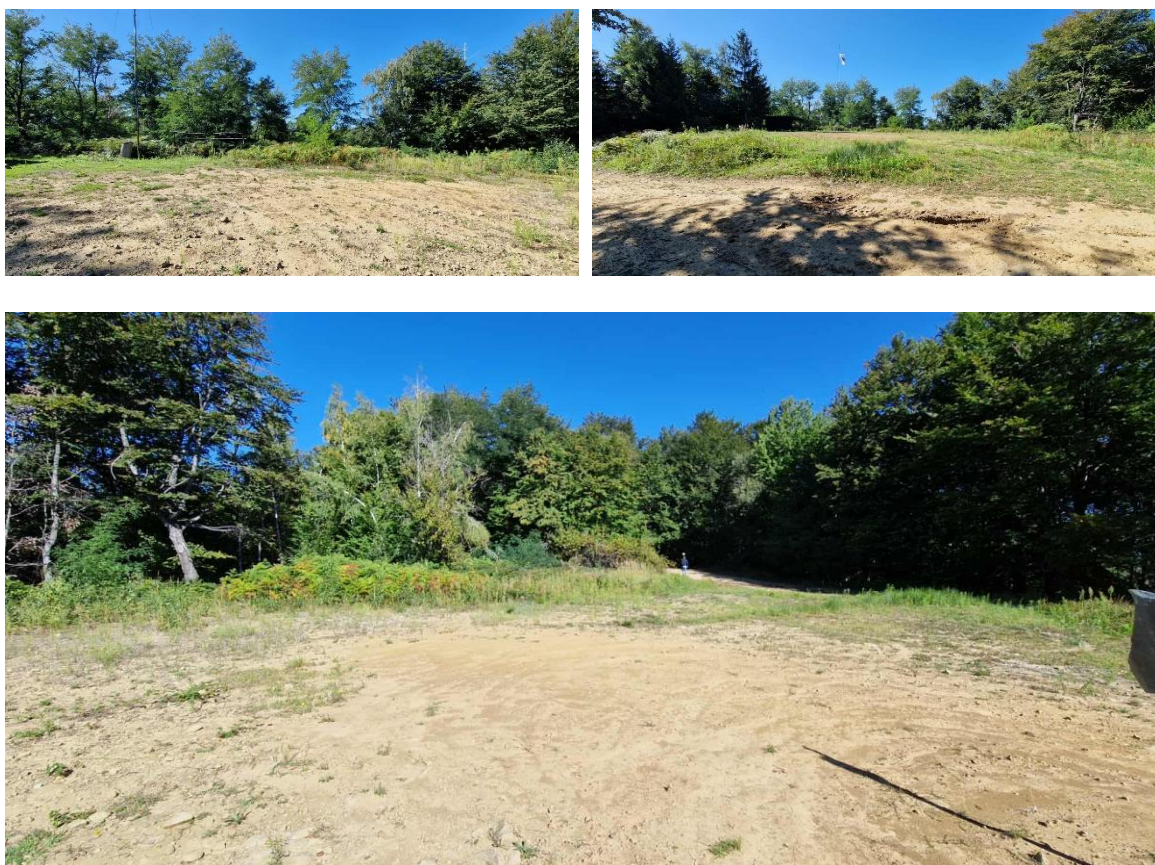
Fotografije dijela predmetne lokacije /zaravnjeni plato/

Lokacija predviđena za izgradnju izletišta Zečja kosa nalazi se izvan urbanog područja Vitinica smještena na dijelu parcele označene kao kč.broj 1, KO Sapna ukupne površine 173.070,00m 2 koja zajedno sa drugim parcelama sačinjava širi šumski kompleks. Kroz parcelu na terenu prolazi zemljani šumski put širine cca 2,7m a na najvećoj koti parcele formiran je zemljani plato u površini od cca 1000m 2 na kome je izgrađena drvena nadstršnica. Sjeverni dio parcele na kome je planirana izgradnja izletišta predstavlja jednu od istaknutih visinskih kota planine majevice koja se prostire na prostoru Općine Sapna.