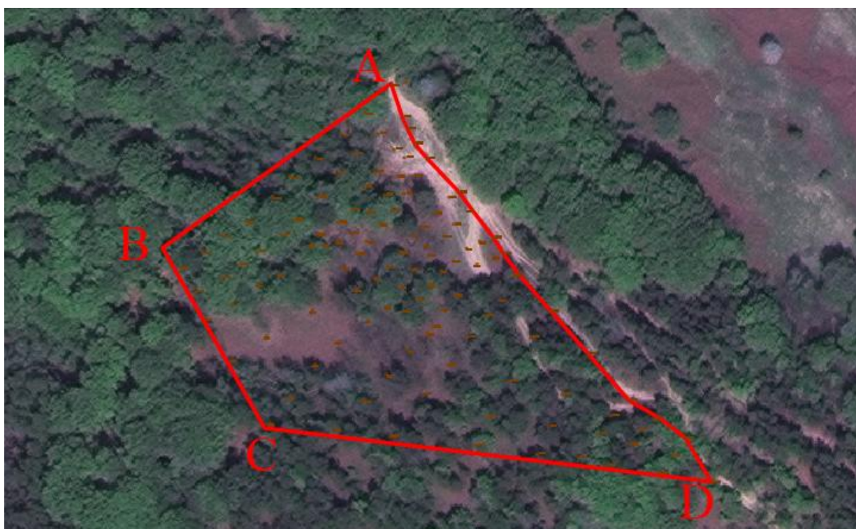
Prikaz predmetnog obuhvata na ortofoto podlozi

Površina obuhvata iznosi 9.255,70m 2 . U površinu obuhvata nije ušla površina pristupnih puteva prema planiranom izletištu Zečja kosa.