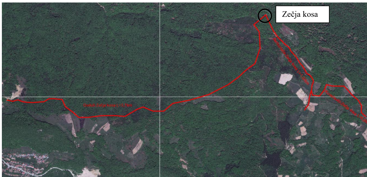
Prikaz postojećih puteva prema Zečjoj kosi na ortofoto podlozi