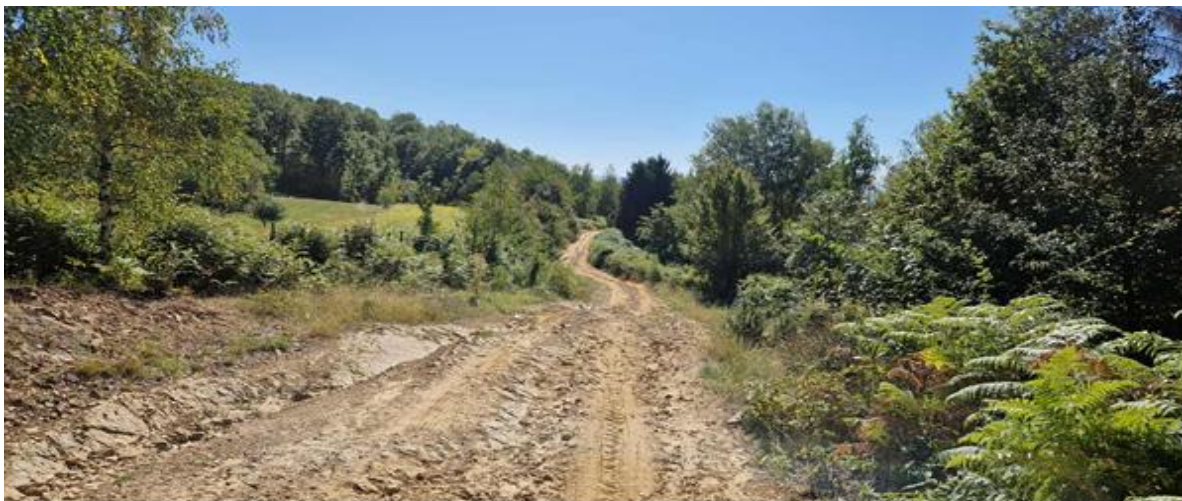
Fotografije dijela pristupnog puta Berizovača – Zečja kosa, L=1.02km